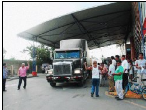
Furgones comenzaron ayer a cruzar la frontera sur.